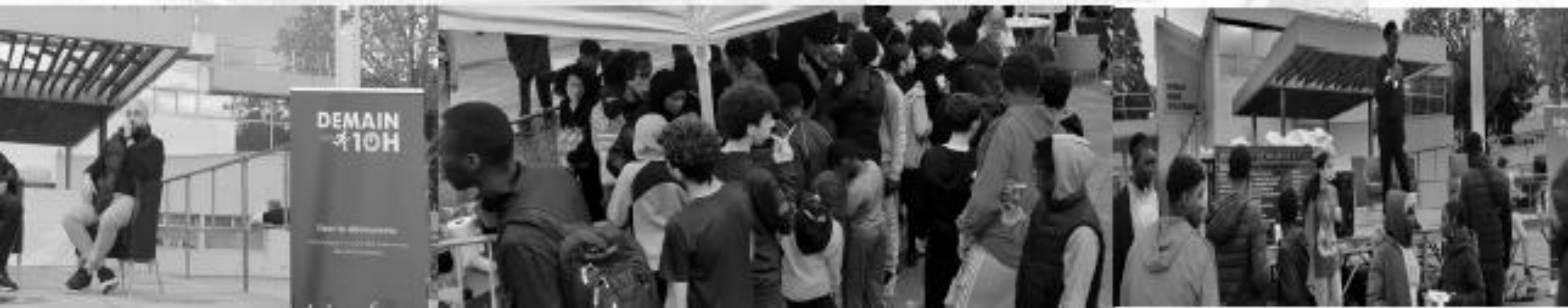
« Demain 10h » édition 2023 Viry -Châtillon 91