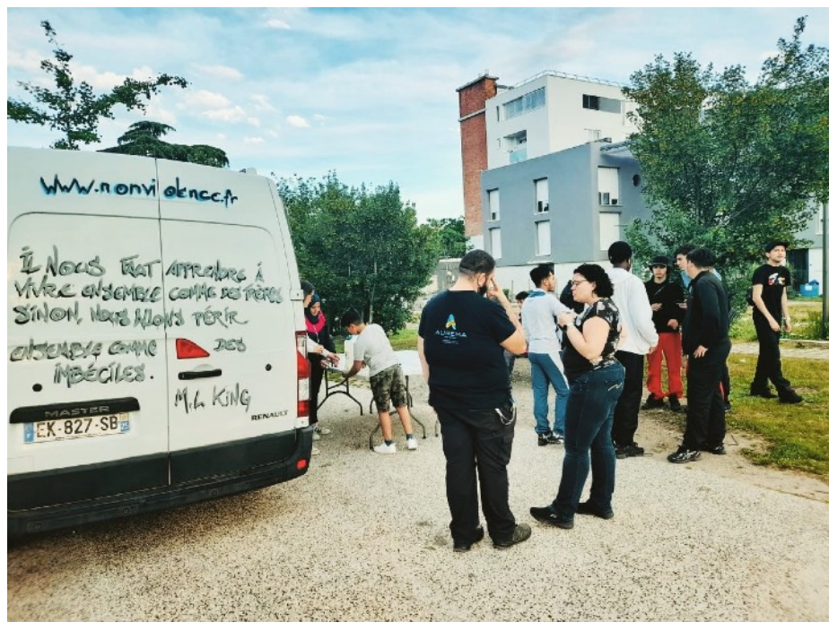
Participation à une médiation nomade organisée par le MAN Lyon (mai 2023)

S'il a été difficile cette année d'animer le collectif des Médiations nomades lancé en 2022, l'association a néanmoins fait du lien avec ses membres.