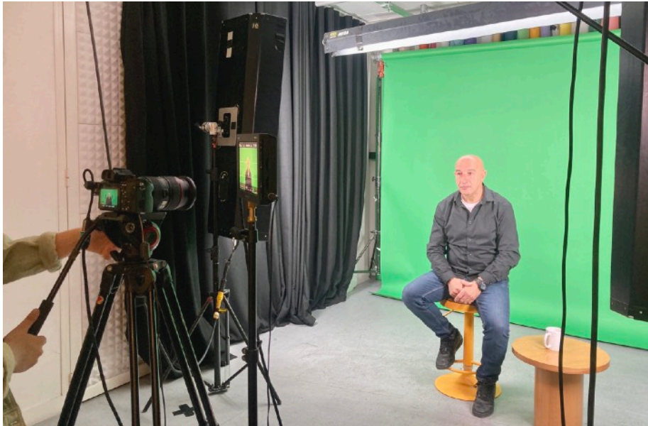
Interview pour Konbini (juillet 2023)

https://www.lien-social.com/%E2%96%A0-ACTU-Yazid-Kherfi-La-repression-au-detriment-de-la-prevention