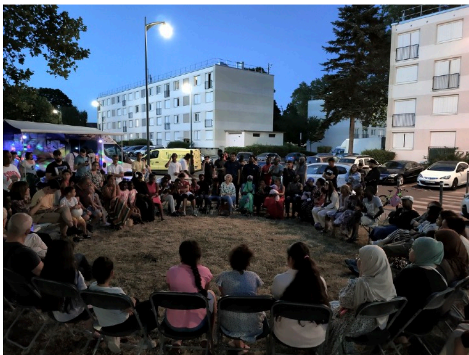
Chilly-Mazarin (juillet 2023)

En 2023, Médiation Nomade a mis en place 12 projets d'aller vers nocturnes - dont 10 projets dans des quartiers prioritaires de la ville*. Ayant installé son dispositif itinérant au pied des immeubles, en soirée, l'association a, pour chaque projet, soutenu l'écosystème territorial ; elle a invité les acteurs des territoires à s'investir dans ces projets nocturnes, et à aller à la rencontre des habitants.