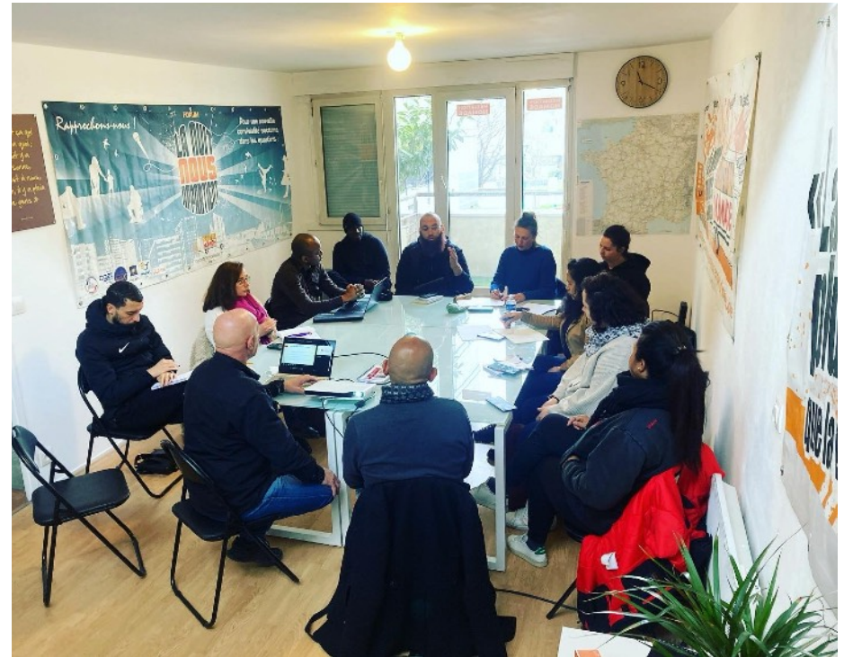
Temps de sensibilisation (Mars 2023)

Ces deux journées, qui étaient aussi l'occasion d'échanger sur les pratiques de chacun·e, ont accueilli une trentaine d'acteurs de terrain exerçant dans différentes régions (Île-de-France, Grand-Est, Pays de la Loire) : des médiateurs sociaux, des éducateurs de la prévention spécialisée, des acteurs de l'insertion professionnelle (dont de missions locales), des acteurs associatifs.