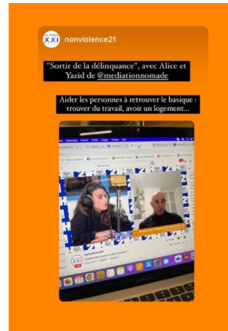
Plateau-radio lors du colloque organisé par NVXXI (novembre 2023)

En novembre 2023, l'équipe de Médiation Nomade s'est exprimée sur les processus de sorties de délinquance et sur la prévention par les pairs, à partir d'expériences vécues au sein de l'association.