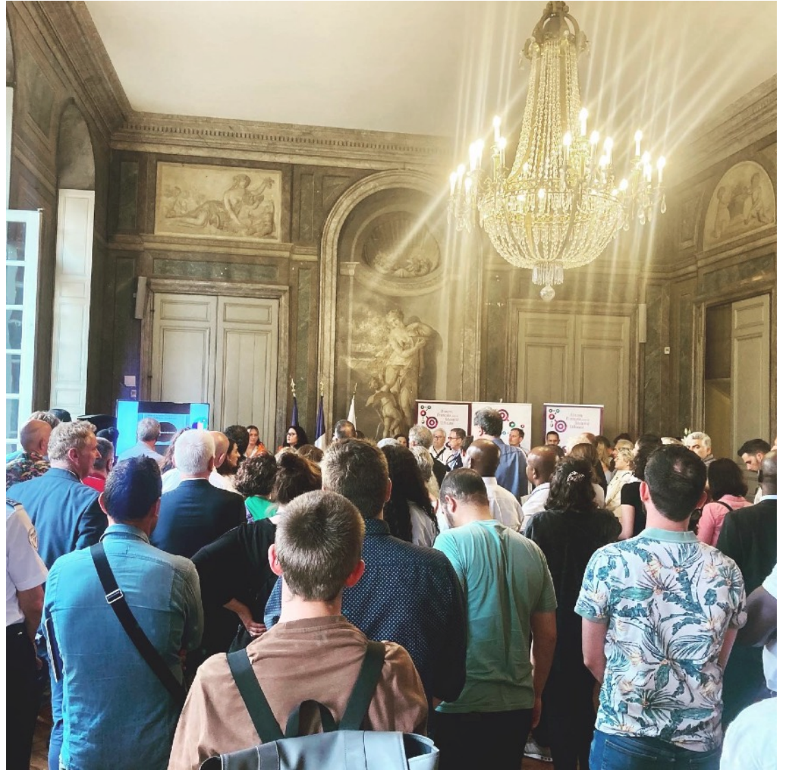
Assises de la sécurité des territoires organisées par le FFSU (Bordeaux, 2023)