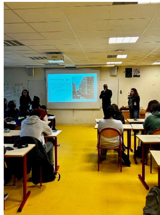
Intervention à l'IUT de Bobigny (octobre 2023)

Faire savoir passe également par des actions de communication sur l'association. Cette année, Médiation Nomade a présenté ses actions à différents publics (professionnels, associatifs, étudiants) - notamment au réseau des référent·e·s sûreté de l'union Sociale pour l'Habitat (USH), à des étudiant·e·s de l'IUT de Bobigny (dans le cadre d'un enseignement), au grand public (festival Libre Ere, Paris ; festival des Idées, Charité-sur-Loire ; La Caravane Héritage en Partage, Bondy et Marseille).