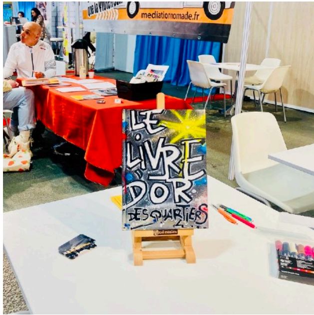
Livre d'or des quartiers (avril 2024)