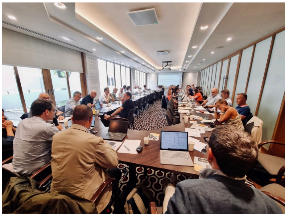
Présentation de Médiation Nomade au réseau des référent·e·s sûreté de l'Union Sociale pour l'Habitat (juin 2023)