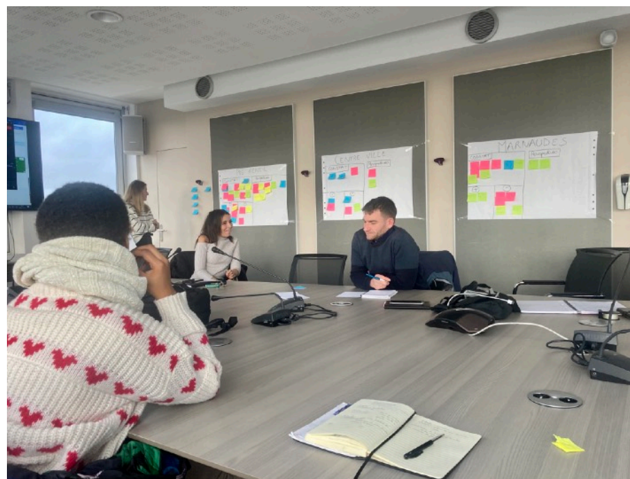
Réunion avec les acteurs locaux (Rosny-sous-Bois, 2023)

Concrètement, elle a initié et contribué, cette année, à des réflexions et actions collectives autour de la vie nocturne dans les quartiers populaires - à la croisée entre la prévention de la délinquance et une politique de la jeunesse : recrutement de médiateurs sociaux, ouverture de gymnases en soirée, animations nocturnes pour les jeunes, mises en lien entre les structures locales et une partie des jeunes, etc.