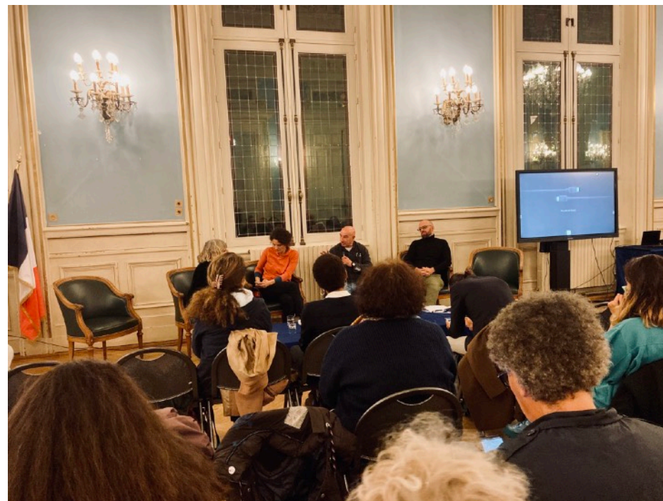
Intervention à la Nuit de la politique de la ville (Paris 20e, 2023)

Sous plusieurs formes, Médiation Nomade a participé, cette année, aux réflexions relatives aux thématiques suivantes : la délinquance et la sécurité urbaine, la politique de la ville et la médiation sociale.