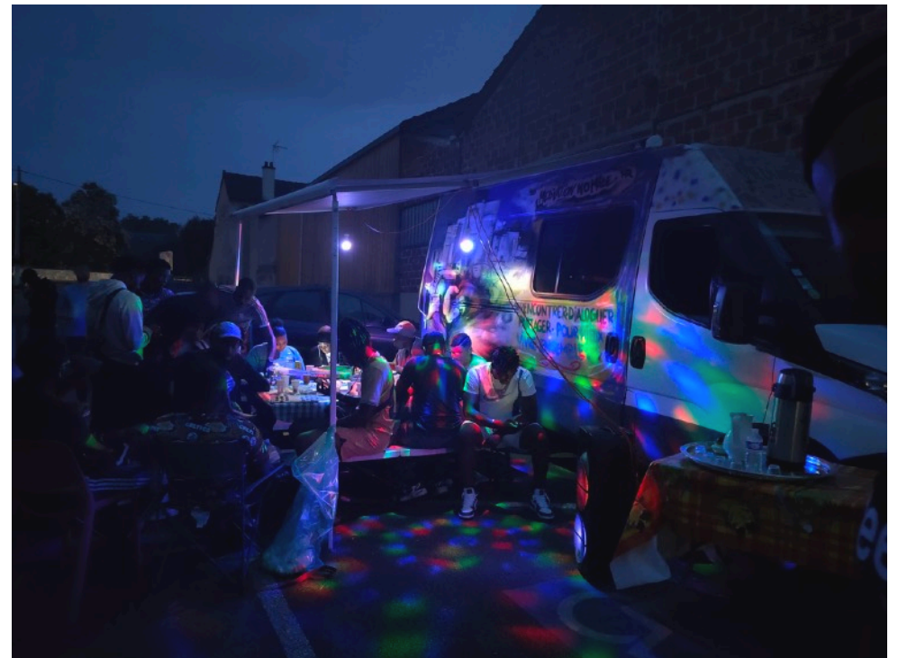
Lagny-sur-Marne (juin 2023)

12 VILLES | 18 QUARTIERS PRIORITAIRES DE LA VILLE ENVIRON 1 000 BÉNÉFICIAIRES