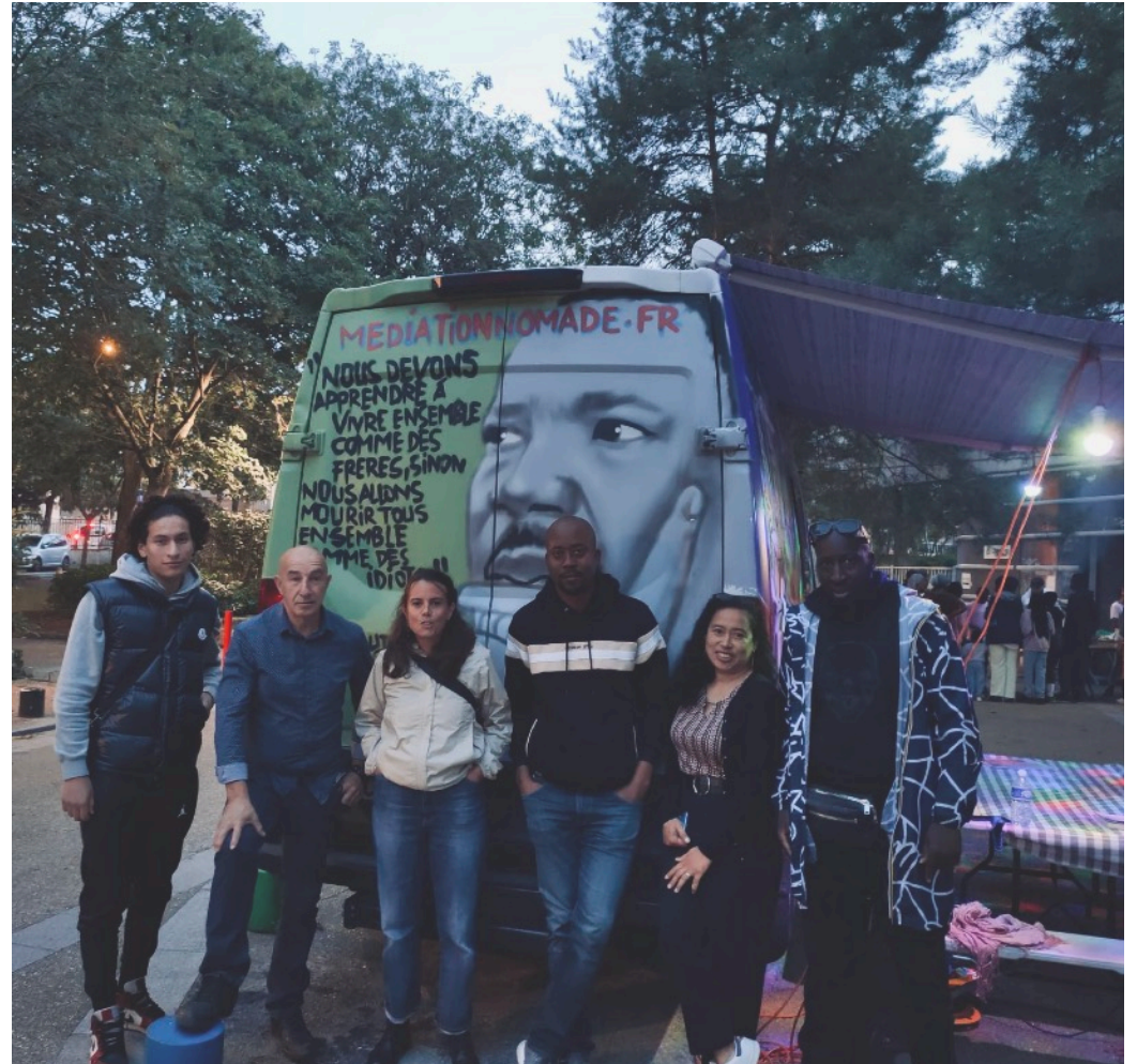
L'équipe salariée et les bénévoles (Cachan, août 2023)

4 SALARIÉ·E·S | 3 STAGIAIRES | 9 BÉNÉVOLES