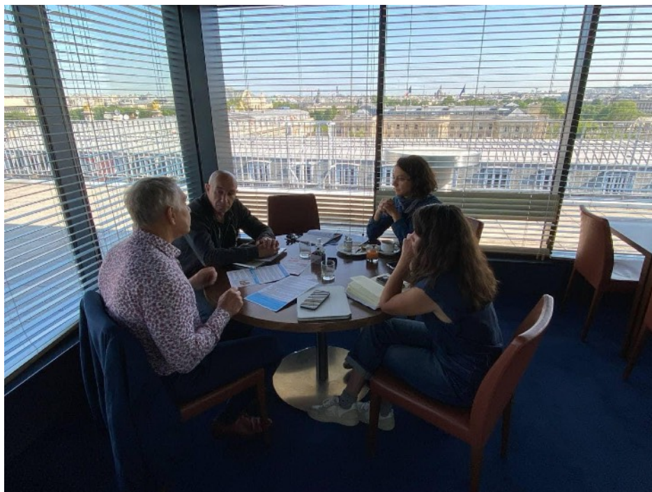
Audition à l'Assemblée Nationale (juillet 2023)

Sous plusieurs formes, Médiation Nomade a participé, cette année, aux réflexions relatives aux thématiques suivantes : la délinquance et la sécurité urbaine, la politique de la ville et la médiation sociale.